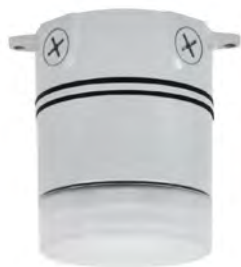
Montage au plafond

Cette série de luminaires est également disponible en montage au plafond ou suspendu .