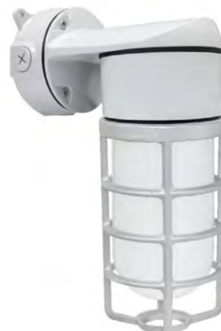
DVBKSX-LED14 illustré avec la protection en fonte GL100F Verre givré.