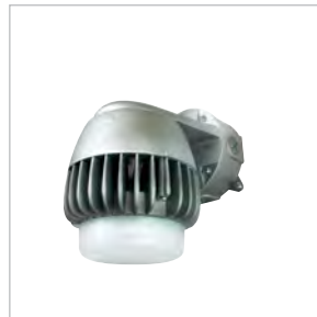
DVBS2-LED Montage mural