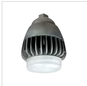
DVCS2-LED Montage pendentif