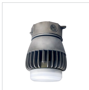
DVAKS2-LED Montage au plafond