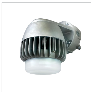
DVBS2-LED Montage Mural