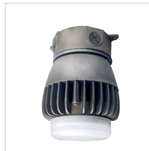
DVAKS2-LED Montage au plafond