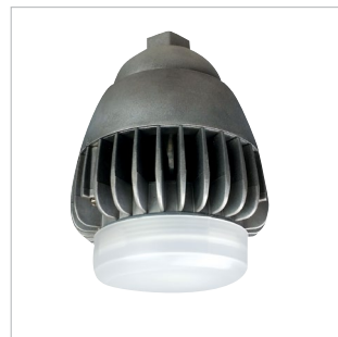
DVCS2-LED Montage pendentif